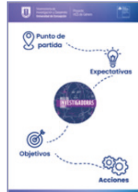
Papelógrafo del taller

Se crearon 9 grupos de trabajo, conformados de forma aleatoria, e integrados por 7 u 8 personas. Cada uno de estos grupos de trabajo estuvo a cargo de una integrante del equipo InES y colaboradoras, quienes desempeñaron el papel de facilitadoras y guiaron las discusiones en torno a una pauta de preguntas. Durante estas discusiones, se utilizó un papelógrafo que presentaba cuatro etapas que guiaron la conversación y en el cual las participantes debían pegar notas adhesivas con las ideas centrales.