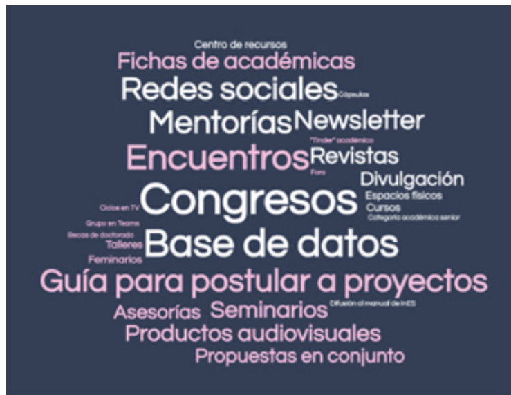
Fig 4: nube de palabras Estación 4.