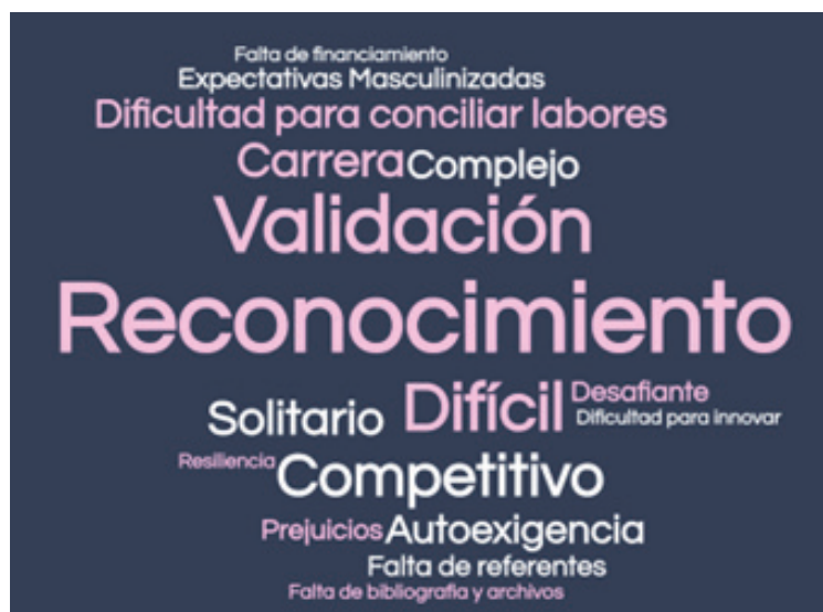
Fig 1: nube de palabras Estación 1.