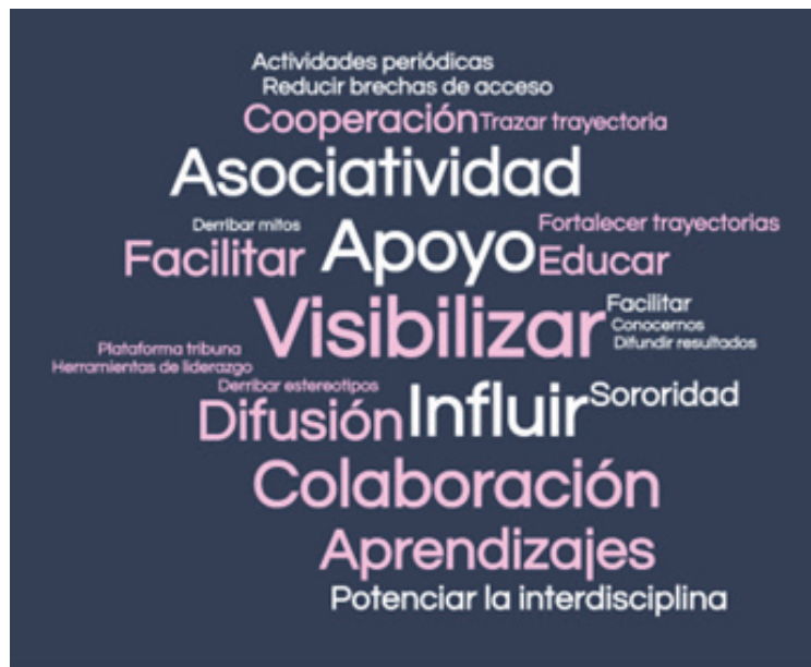
Fig 3: nube de palabras Estación 3.